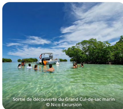
Sortie de découverte du Grand Cul-de-sac marin

Ces sorties sont l'occasion d'observer la faune guadeloupéenne, comme les oiseaux tropicaux et les iguanes, ou de découvrir les plantes médicinales locales. Les participants pourront aussi écouter les récits sur l'histoire naturelle et humaine de la Guadeloupe, ou admirer des panoramas spectaculaires sur la mer des Caraïbes. Les plus aventureux pourront opter pour des parcours plus sportifs, comme la montée du volcan de la Soufrière, pour une expérience entre terre et ciel.