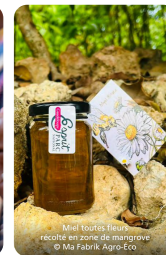
Miel toutes fleurs récolté en zone de mangrove