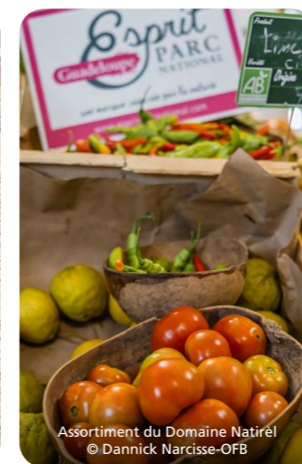
Assortiment du Domaine Naturel