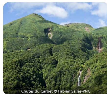
Chutes du Carbet