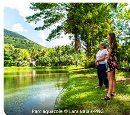
Parc aquacole