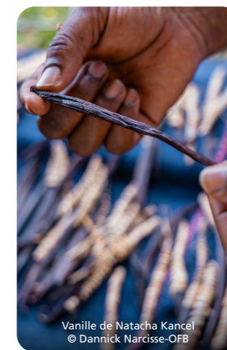
Vanille de Natacha Kancel