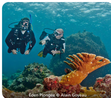
Éden Plongée